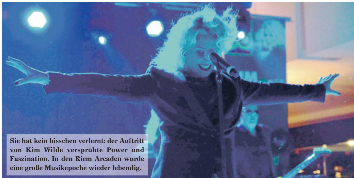
Sie hat kein bisschen verlernt: der Auftritt von Kim Wilde versprühte Power und Faszination. In den Riem Arcaden wurde eine große Musikepoche wieder lebendig.